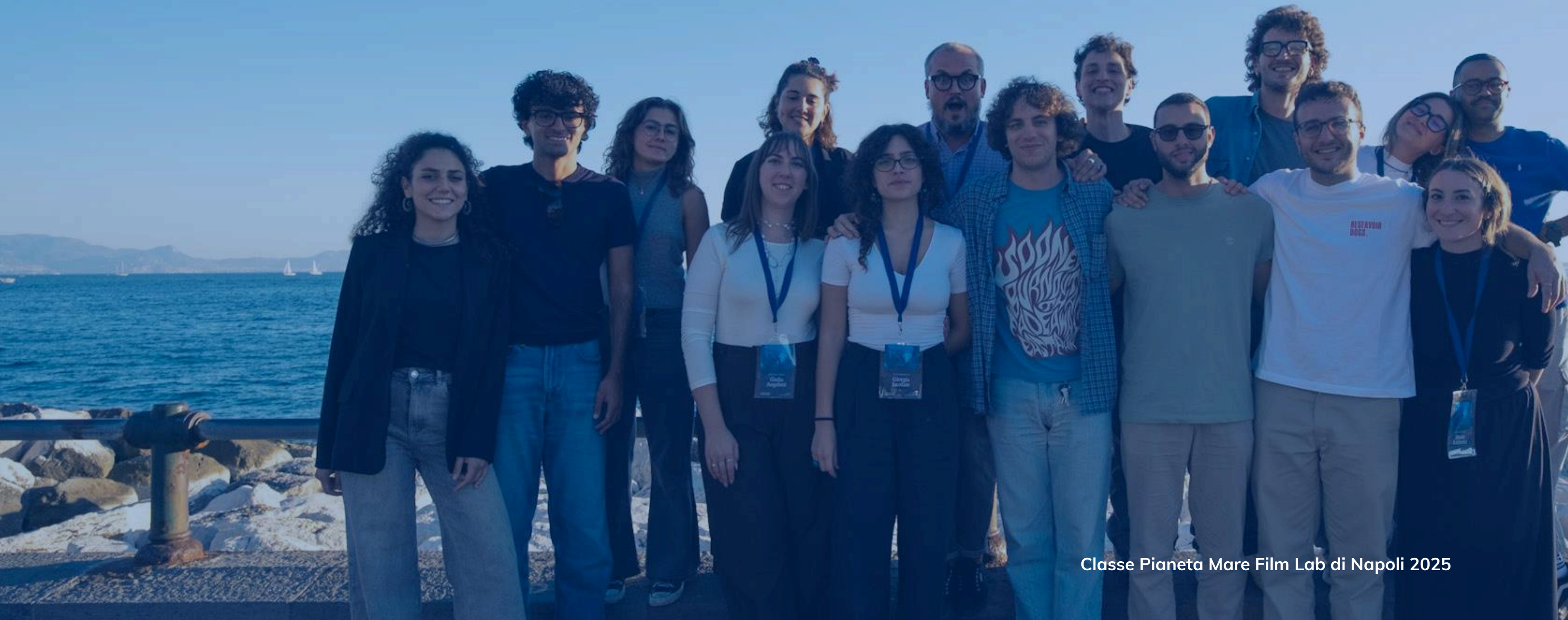
Classe Pianeta Mare Film Lab di Napoli 2025

Dal 2025 il Pianeta Mare Film Lab è diventato un progetto formativo e di divulgazione scientifica itinerante con un Giro d'Italia nelle città di Genova, Venezia, Lecce e Napoli . Grazie alla partnership con le principali istituzioni nazionali, locali, le università, alcuni istituti del CNR, l' obiettivo del 2026 è di portare il Film Lab in nuove città come Roma, Palermo, Ancona, Cagliari, Taranto, oltre a Genova e Napoli .